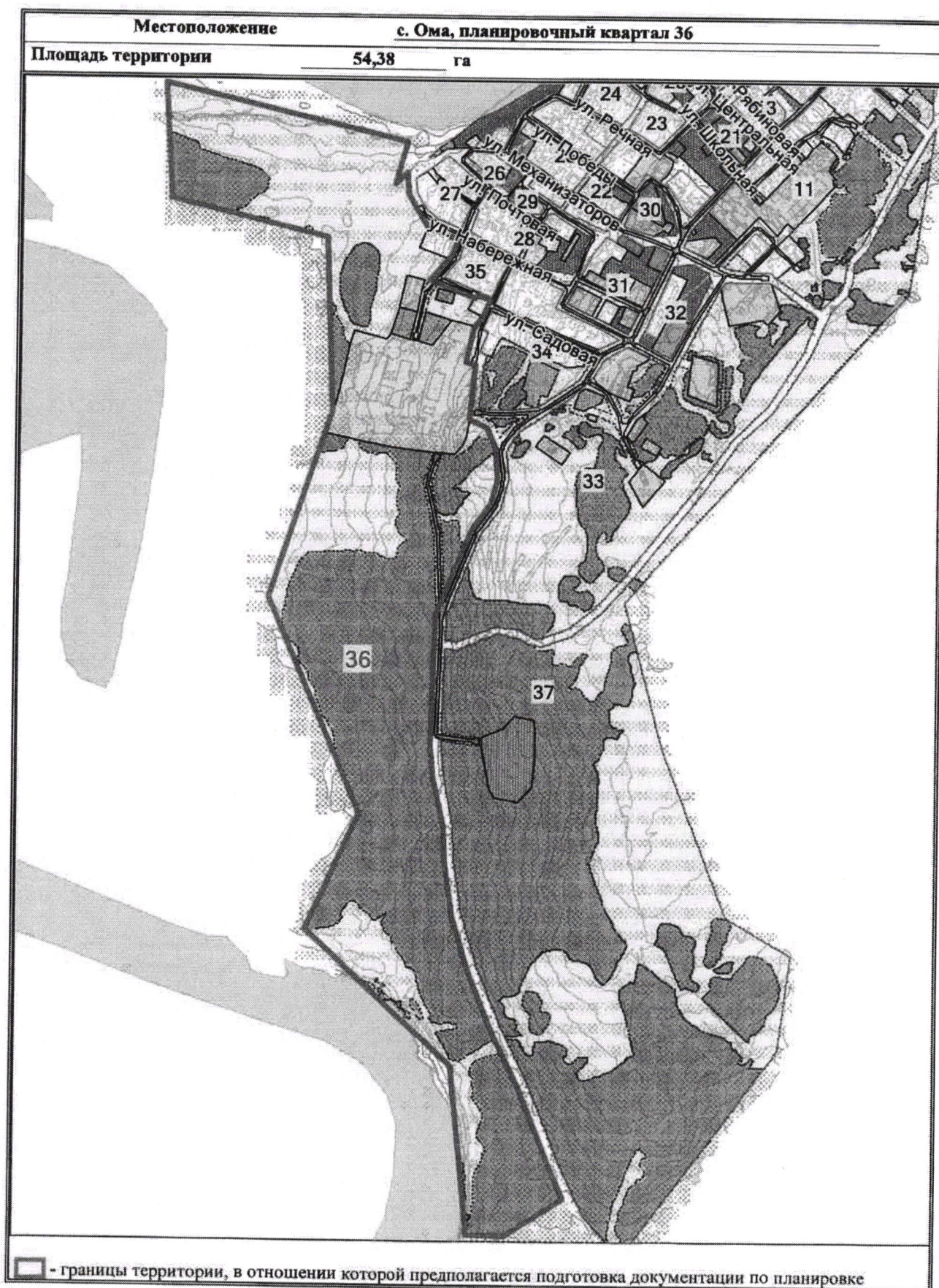
Схема территории, в отношении которой предполагается подготовка документации по планировке территории (масштаб 1:10000)